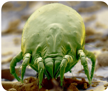
تصویر ۳: مایت

هییره‌ها بندپایانی میکروسکوپی هستند (حدوداً ۰/۳ میلی‌متر) که با چشم غیرمسلح دیده نمی‌شوند. تغذیه این موجودات از پوسته‌ریزی بدن انسان است. محل زندگی این حیوان در لابه‌لای پرزهای فرش، پتو، میلمان، پرده، تشک، بالش، اسباب بازی‌های پشمی و پارچه‌ای و وسایل مشابه است. شرایط آب و هوایی گرم مرطوب - (مثلاً در زمستان که اکثراً درب و پنجره‌ها بسته است و اغلب از بخور نیز