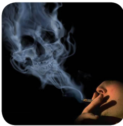
تصویر ۴: دودسیگار