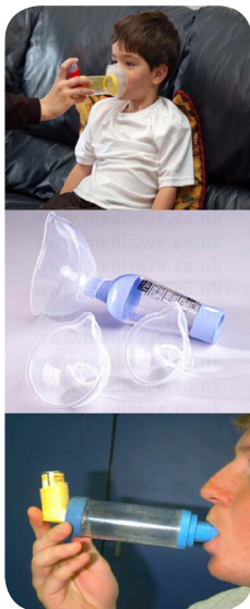
تصویر ۶: محفظه مخصوص