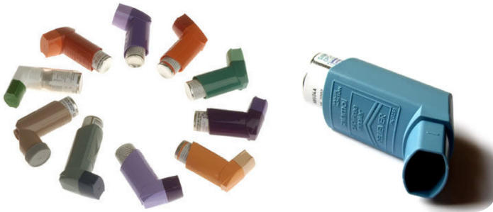
تصویر ۷: افشانه یا MDI